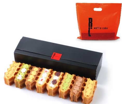
▲ シックな墨色のパッケージ