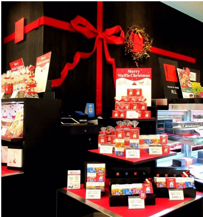
R.L千葉店（イオンモール千葉ニュータウン1階）

今回のディスプレイコンテストは、コロナ渦での開催ながらも200点近い作品の応募があり、その多数の応募作品の中からR.L(エール・エル)千葉店のクリスマスディスプレイが<大賞>を受賞いたしました。 「商品のディスプレイだけでなく店舗の構造自体も含めたトータルな演出」が高く評価されました。