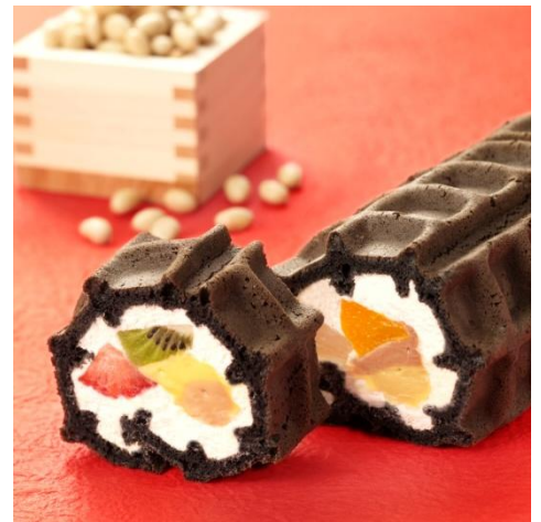
★ユニークなワッフルの恵方巻。ご予約承ります。