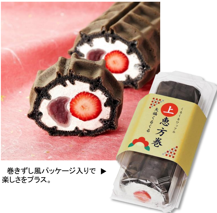
巻きずし風パッケージ入りで ▶ 楽しさをプラス。

もちっとした求肥と上品な甘さの粒あん、まるごとのあまおうを大胆にロールしました。北海道産生クリーム*を使用したホイップクリームの濃いミルクの風味と、和の素材が絶妙にマッチ。上質な素材で作りに上げたワンランク上の恵方巻スイーツです。