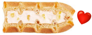
■ ホワイトチョコレモン:120円