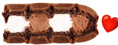
■ ジャンドウーヤショコラ:130円