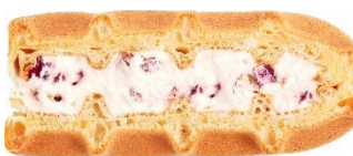
■ チーズ克蘭ベリーナッツ:120円