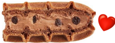
■ 大人のビターショコラ:130円