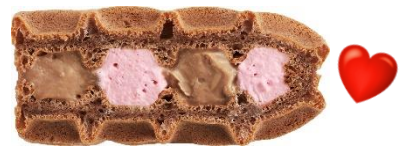
■ ベリーショコラ:120円