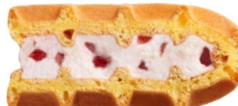
ストロベリーホワイトチョコ:137円