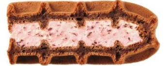
チョコインストロベリー:126円