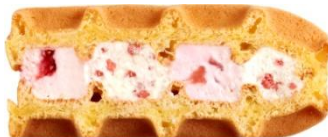
ホワイトチョコいちご:137円